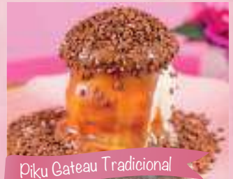
Piku Gateau Tradicional