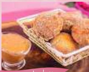
Bolinho de chuva