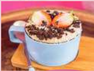
Palha Italiana Cookies 'n Cream