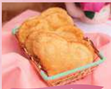
Pastelzinho de Queijo