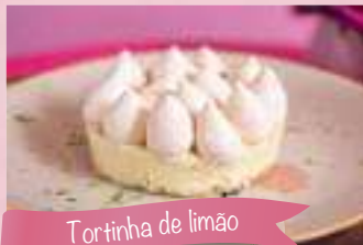
Tortinha de limão