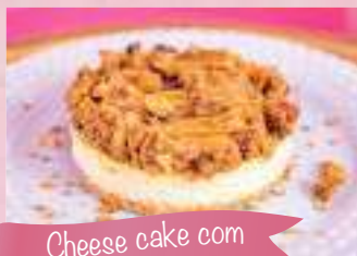
Cheese cake com doce de leite e crumble