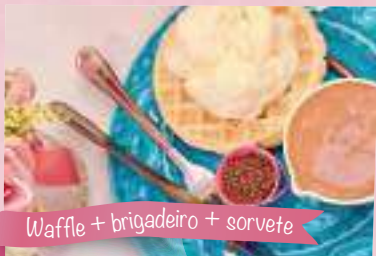
Waffle + brigadeiro + sorvete