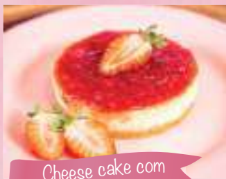
Cheese cake com geleia de morango