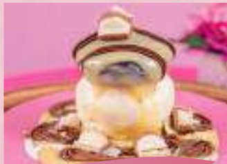
Piku Gateau Kinder Bueno