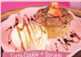
Torta Cookie + Sorvete