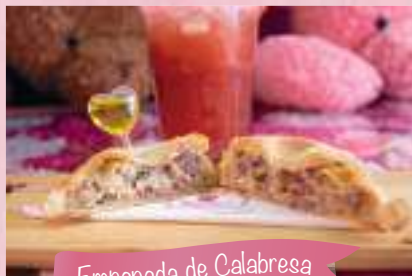
Empanada de Calabresa com Catupiry