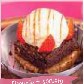
Brownie + sorvete