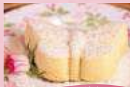
Pudim de Leite Ninho