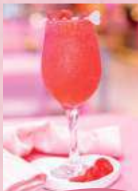
Frozen Fo FINI