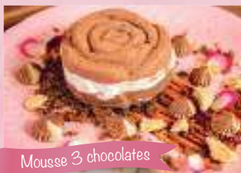
Mousse 3 chocolates