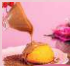
Bolo do dia com cobertura de belga